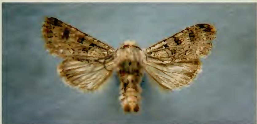
FIGURA 1. Ejemplar adulto de Scriptania inexpectata n.sp.